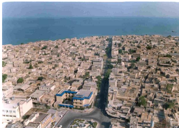
شکل ۳: بافت قدیم بوشهر

بندر بوشهر از زمان پایه گذاری نخستین سنگ بنای آن تا کنون تحولات بسیار را پشت سر گذاشته است. زمانی از هسته ای کوچک به شهری بزرگ تبدیل شده و زمانی تخریب ها و تغییرات کالبدی از وسعتش کاسته و چهره اش را تغییر داده اند. در قسمت مطالعات تاریخی، روند رشد و ادامه حیات شهر در دوران های مختلف تاریخی تا اواخر دوره قاجار بررسی شد. عمده ترین تغییر و تحولات کالبدی در دهه های اخیر اتفاقی است. به همین دلیل در این قسمت سعی خواهد شد تا تغییر و تحولات کالبدی بافت قدیم از شروع دوران پهلوی تا زمان حال در ۵ مرحله زمانی طرح و بررسی شود.