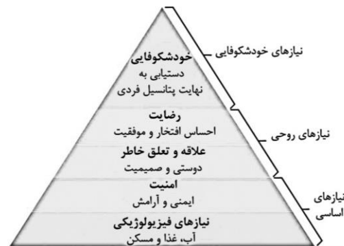
شکل ۱: هرم نیازهای مازلو، منبع ترجمه از مازلو ۱۹۵۴

لزوم پرداخت به مبحث امنیت خود بر خواسته از نقشی است که این عامل در حیات جمعی دارد. این نیاز بیانگر آن است که فرد به آرامش حاصل از ثبات، استقلال، محافظ داشتن، رهایی از ترس، رهایی از اضطراب و رهایی از درهم ریختگی و بی‌نظمی محتاج است. توجه به مقوله‌ی امنیت همچنین بخاطر تاثیرات قابل توجهی است که عدم امنیت در رفتارهای انسانی می‌گذارد.